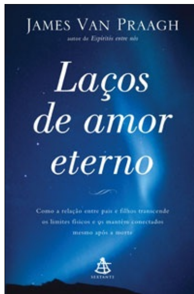
Laços de amor eterno James Van Praagh

Emocionante e inspirador, esse livro já ajudou pessoas de todo o mundo a superar a dor de suas perdas e a adquirir uma nova compreensão da vida e da morte.