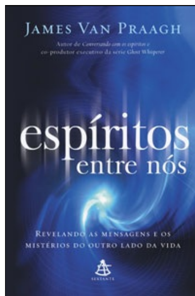
Espíritos entre nós James Van Praagh

Esse livro vai responder a seus questionamentos mais profundos sobre o porquê de vidas tão promissoras serem precocemente interrompidas. Mais do que isso, ele revela que os laços de amor que unem pais e filhos são criados na eternidade, e nem mesmo a morte é capaz de destruí-los.